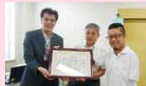
中電ウイング事業場祭 チャリティバザー実行委員会様