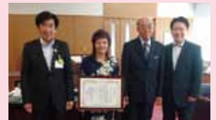
カラオケ同好会すずめの学校様

募集 南区社会福祉協議会では、地域福祉活動を充実するために、寄付を募集しています。皆さまのご協力をお待ちしております。