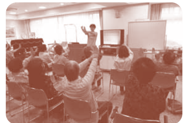
なんでも相談会(ケアマキス・カフェ)の様子