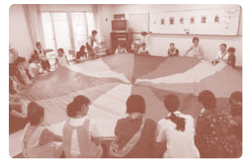
子育てサロンとの異世代交流会