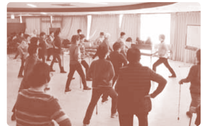
30年度の体験会の様子